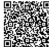
凱基人壽防詐專區

凱基人壽客戶服務專線 Layanan konsumen KGI Life Insurance : 0800-098-889; 海外諮詢專線Konsultasi di luar negeri (須付費berbayar) : 該國國際冠碼Kode telepon internasional +886 2-6601-5760